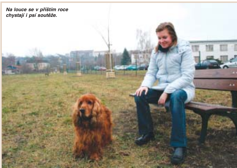
Na louce se v příštím roce chystají i psí soutěže.