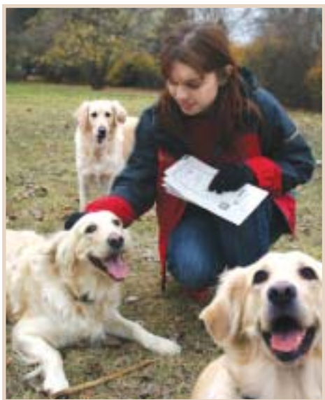
Příklad zodpovědné majitelky psů. Používá pytlíky na psí exkrementy.

Co se týče zeleně, provedlo se vysazení jedenácti platanů javorolistých. -vlk-