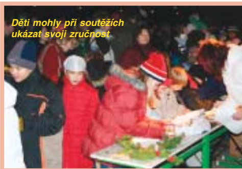
Děti mohly při soutěžích ukázat svoji zručnost.