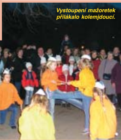
Vystoupení mažoretek přilákalo kolemjdoucí.