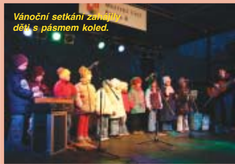
Vánoční setkání zaměřilo děti s pásmem koledí.