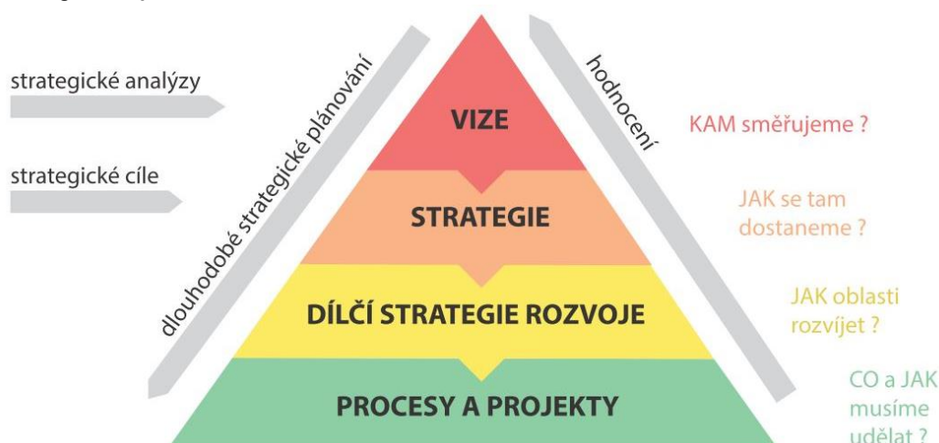
Schéma strategického plánování

Předpokladem pro úspěšné dosažení cíle projektu je vzájemně provázaná realizace všech činností a jejich následná vzájemná synergie.