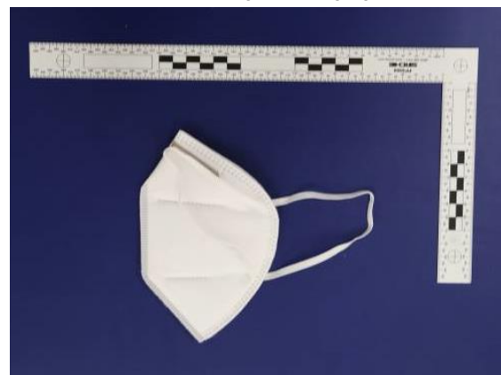
Seitenansicht / Side view