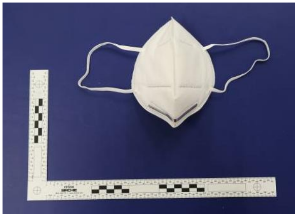
Frontansicht / Front view