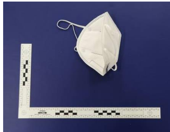
Innenansicht / Inner view