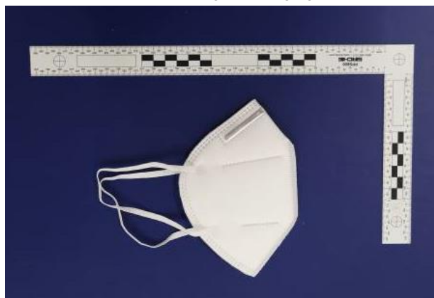
Seitenansicht / Side view