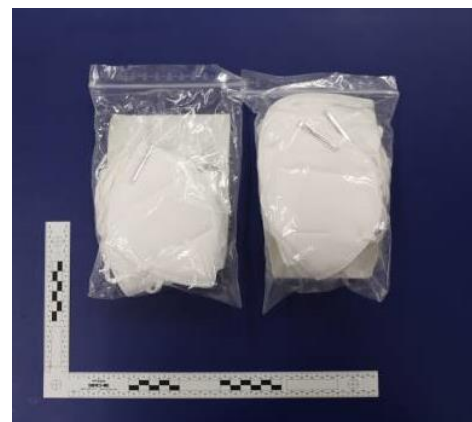
Verpackung / Packaging