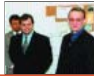
Otevření informačních kanceláří