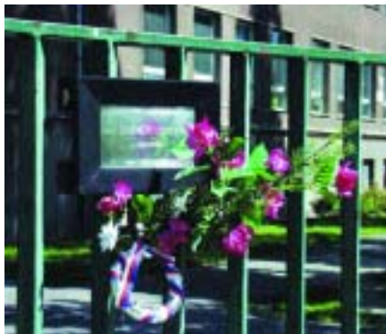
Pamětní deska v ulici U školské zahrady.