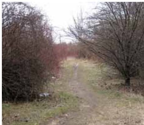
Takto nyní vypadá pozemek, na kterém by měl nový sběrný dvůr stát

Sběrný dvůr ve Voctářově ulici v Libni zřejmě ještě v letošním roce ukončí svůj provoz. Pozemek totiž nepatří Městské části Praha 8 a jeho vlastník s ním má jiné záměry. Obyvatelé nejen osmého pražského obvodu ale nemusejí mít z uzavření dvora obavy.