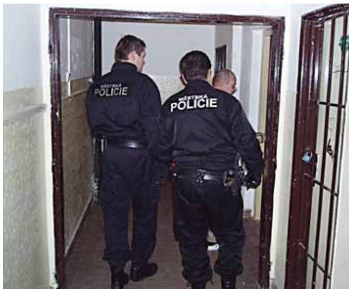
Kontrolní akce se uskutečnila především na přání občanů