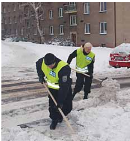
Městští strážníci rovněž pomáhali odklízet sněž z přechodů pro chodce

Obleva s sebou zase přinesla padání sněhových čepic z domů a až metrové špičaté rampouchy, které ohrožovaly chodce na chodnících a zaparkovaná vozidla. Řadu chodníků tak museli strážníci zabezpečit páskami. Strážníci se ale do odklízení sněhu na území Prahy 8 pustili podle Skalky i osobně, nejčastěji ho odhrabovali z přechodů, které byly často neprůchodné. Tři členo-