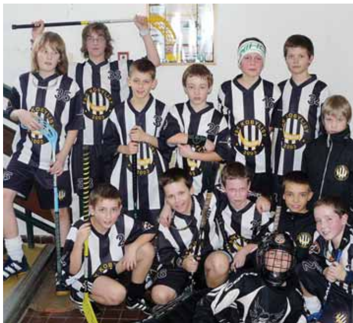
V Kobylisích zaznamenává florbalové úspěchy většina věkových kategorií

Oddíl, založený v roce 2003, čítá celkem 130 členů, z toho 110 v mládežnických kategoriích. Sedm týmů hraje mládežnické kategorie, dvě mužstva soutěže dospělých. Od příští sezony by florbalisté založením družstva veteránů rádi zaokrouhlili počet kobyliských týmů na rovných deset. Nejen proto rádi přivítají nové členy všech věkových kategorií. Bližší informace najdete na www.vikingkobylisy.wz.cz . -mk, pb-