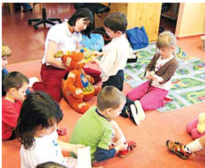
V MŠ Doláková děti učí, jak pečovat o své zdraví

Děti se bezprostředně a s chutí vžily do role toho, kdo je nemocný, i toho, kdo léčí. Beseda vhodně navázala na další akce a výchovné chvílky, které průběžně zařazujeme do našeho vzdělávacího programu v rámci orientace na zdravou mateřskou školku. Takovou, kam chodí všichni s úsměvem a rádi. Děti i dospělí. -red-