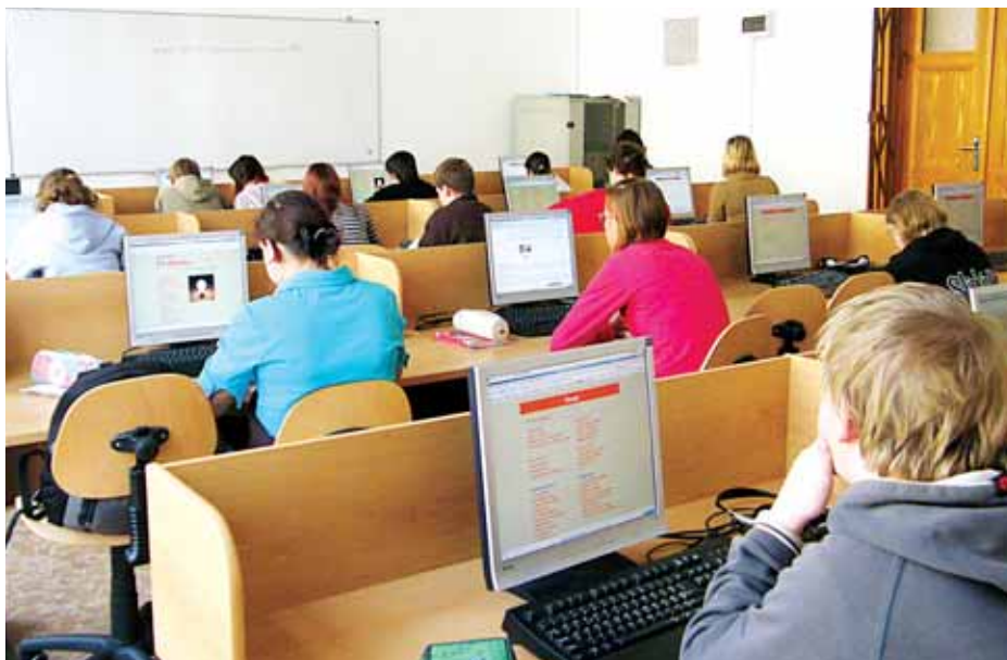
Ve škole na Palmovce se děti s novou technikou seznamují již více než 22 let

Tomuto trendu odpovídá i vybavení naší školy. Počítačové učebny máme již dvě. Samozřejmostí je zasíťování ostatních učeben a vysokorychlostní připojení k internetu. Všechny třídy I. stupně mají svou vlastní interaktivní tabuli. Dalších pět