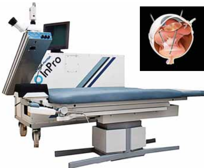
Excimerový laser rychle a přesně odstraňuje krátkozrakost

najít na webových stránkách www.ocni-laser.cz . Tyto operace, stejně jako na jiných pracovištích, nejsou hrazeny zdravotními pojišťovnami.