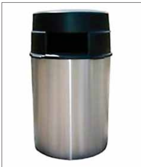
Průřez bezpečnostním košem BlastGard a jeho reálná podoba