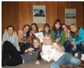
HO-TA-PO uspělo v Budějovicích

Soubor hledá zájemce, chlapce i dívky ve věku 9 až 26 let, kteří a které se chtějí přidat a případně se zúčastnit další soutěže o postup na stejné mistrovství pro skupiny (8 až 15 členů) a formace (od 16 členů výše). Bližší informace najdete na www.ho-ta-po.ic.cz . -jm, pb-