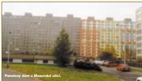
Panelový dům v Mazurské ulici.