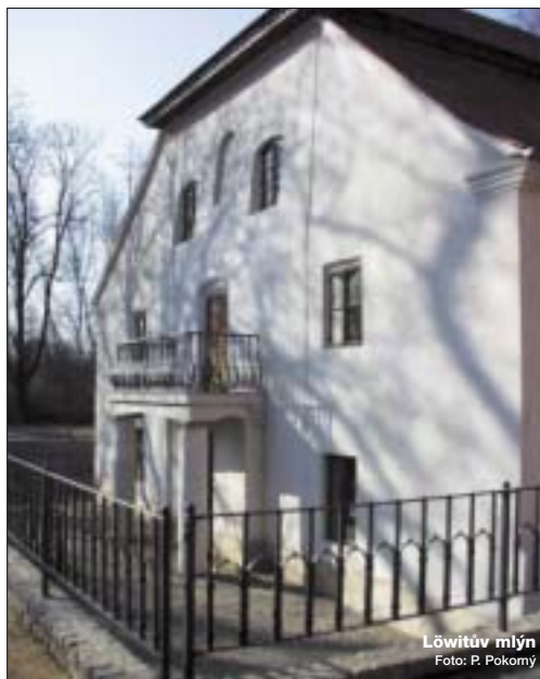
Löwitův mlýn

jíž tehdy byla v havarijním katastrofálním stavu. Dřevě užíval prostory pro sklad brambor i národní podnik Zelenina Praha. Rekonstrukce zahájená v roce 1970 byla provedena pouze v č. p. 39. V roce 1980 byl objekt mlýna uvolněn a předán Státním restaurátorským ateliéřům, které zde chtěly zřídít malířské ateliéry, labora-