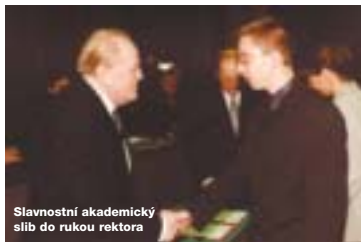
Slavnostní akademický slib do rukou rektora

Soukromá vysoká škola ekonomických studií, s. r. o. byla řádně akreditována Ministerstvem školství, mládeže a tělovýchovy ČR, dne 21. 8. 2000. Akreditováno bylo bakalářské studium ve studijních programech management organizací a účetnictví.