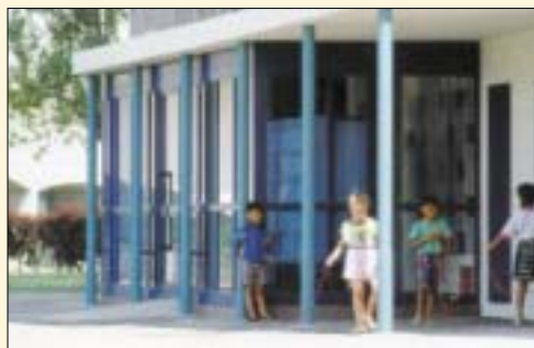
Vstup je vřívtkou domu a má velký vliv na vytvoření dojmu z celého objektu. Nutné úpravy vstupu je vhodné využít k jejich kultivaci a odlišení.

Toto je jeden z významných poznatků pocházejících z empirických sociologických výzkumů konaných