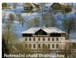
Rekreační chata Bratrouchov

Tato preventivní akce by se neuskutečnila bez rozhodnutí Rady