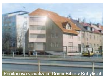
Počítačová vizualizace Domu Bible v Kobylisích

V podzemí, které bude mít plochu cca 500 metrů plošných, bude vedle nezbytné parkovací plochy především velký sklad, do něhož převezeme knihy, které nyní skladujeme mimo Prahu. V samotném objektu bude sídlo České biblické společnosti, přednáškový sál, velká