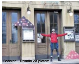
Bohnice - Divadlo Za plotem