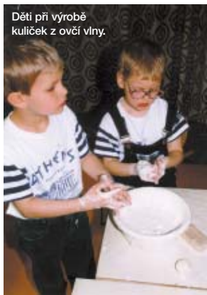
Děti při výrobě kuliček z ovčí vlny.

Vážení čtenáři, dovolte, abychom vám nabídli některé aktivity oddělení ekologie Domu dětí a mládeže Prahy 8. Oddělení ekologie sídlí v Krynické ulici na konečné autobusu 144, 177 a 202.