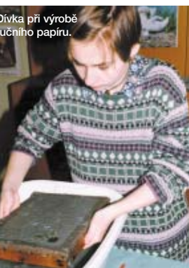
Divka při výrobě ručního papíru.

Nakonec bychom vás rádi upozornili na kroužek Kaštanek, který se schází každý čtvrtek od 14:00 do 16:00. Každou třetí sobotu v měsíci se v rámci tohoto kroužku koná výlet do blízkého i vzdálenějšího okolí. Na tyto výlety je možno se přihlásit i mimo kroužek. Veškeré informace o všech našich aktivitách a také přihlášky získáte na adrese DDM, Krynická 490, 181 00 Praha 8 nebo na telefonu 855 37 90 a 855 21 01. Za pracovníky oddělení ekologie