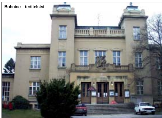
Bohnice - ředitelství

Gabriela Dousková