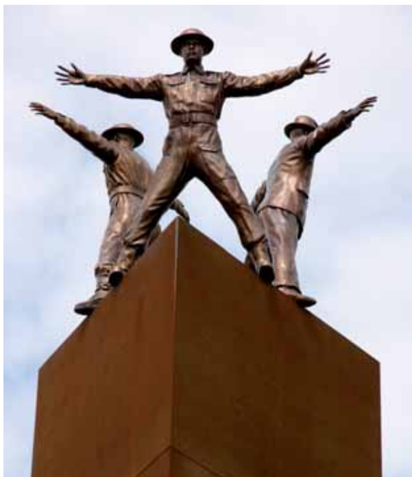
Pomník Operaci Anthropoid